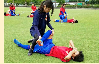
病院やスポーツ現場で働く理学療法士