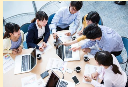
学生の自主性を促す ゼミナール制とハイレベルな教育展開