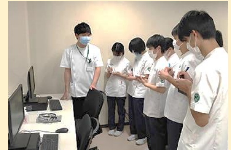
学内演習と臨床実習の綿密な連携