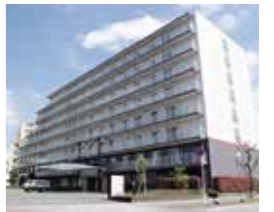
学生寮・公津の杜ハイツ(全室個室) 成田キャンパスから徒歩5分

本学に入学された方は千葉県介護福祉士修学資金(最大168万円)などを活用することができます