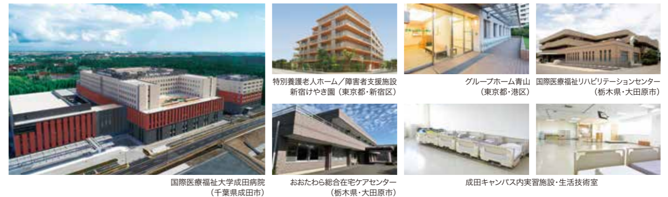
国際医療福祉大学成田病院 (千葉県成田市)

国際医療福祉大学グループには、以下のようにさまざまな介護福祉施設があります。これらの施設と成田キャンパス近隣の施設において、充実した実習を行っています。