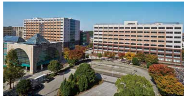
国際医療福祉大学成田キャンパス